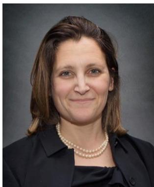
L'honorable Chrystia Freeland Ministre des Affaires étrangères