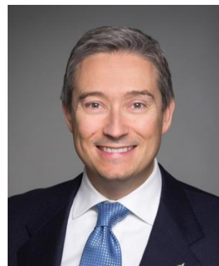
L'honorable François-Philippe Champagne Ministre du Commerce international

Aujourd'hui, le Canada est un fier champion de la paix, de la justice et de la prospérité inclusive.