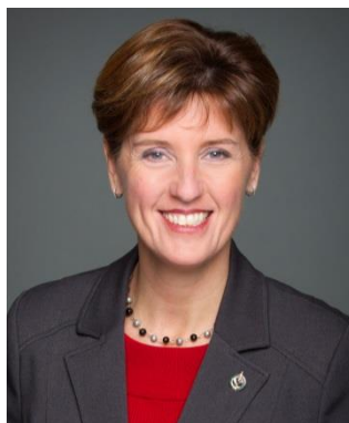
L'honorable Marie-Claude Bibeau Ministre du Développement international et de la Francophonie